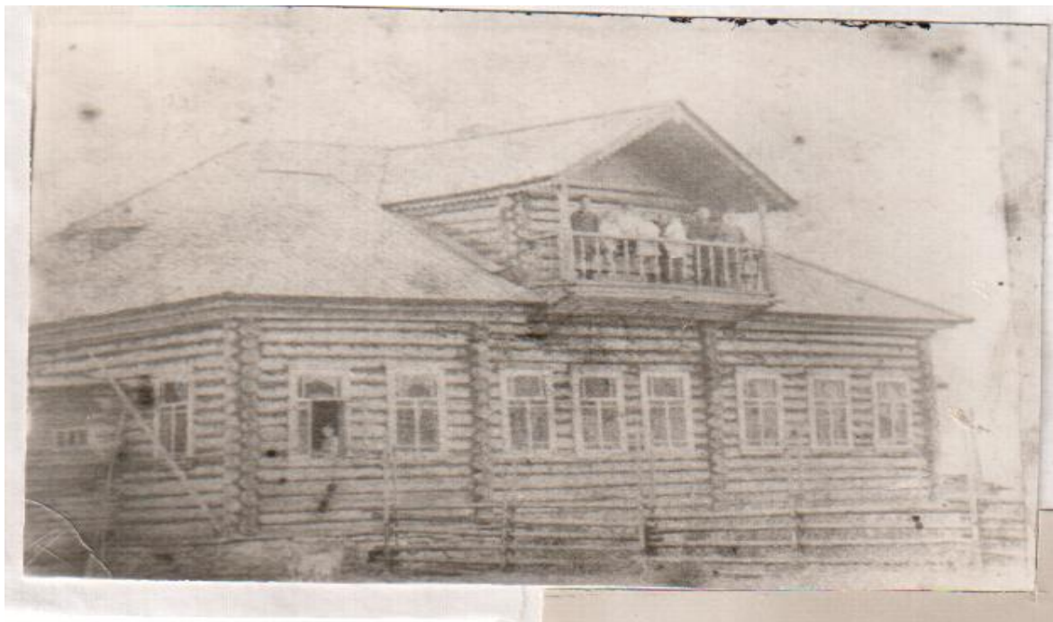
Усть-Немское начальное училище

В 1890 году было построено первое специализированное школьное здание