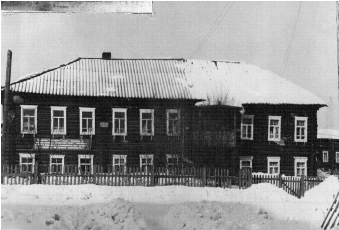
Здание школы колхозной молодежи