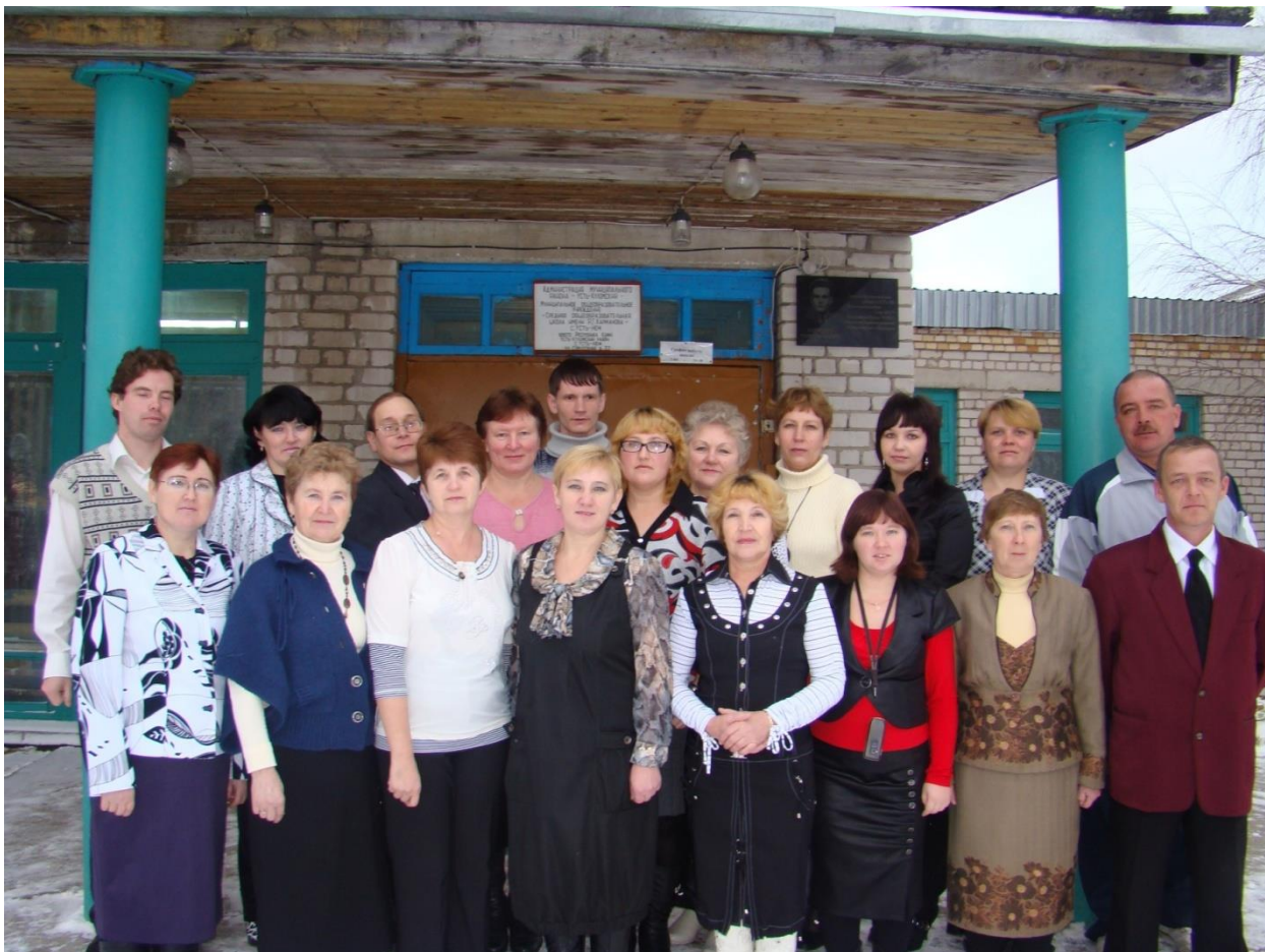
Коллектив учителей 2010 г.